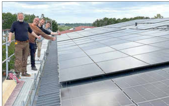
Freude über die zweite Photovoltaik-Anlage bei den Mitgliedern von WirMachenEnergie eG

Weitere Info über WirMachenEnergie eG sowie einen ausführlichen Projekt-Steckbrief gibts unter www.wme-eg.de .